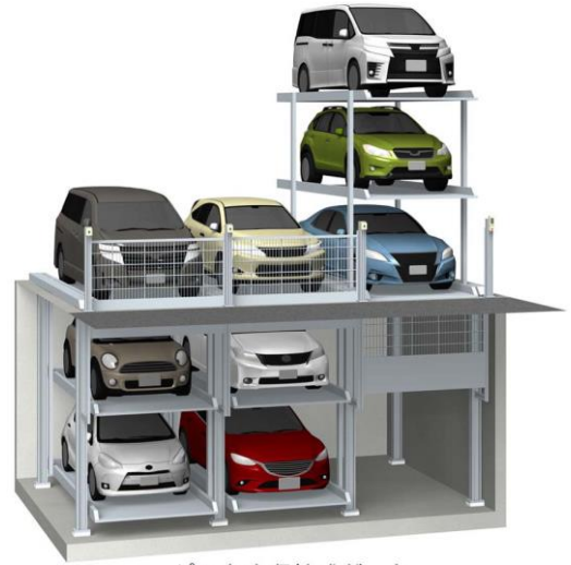
ピット内収納式ゲート