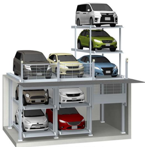
ピット内収納式ゲート

■必要ピット深さが従来より浅いため、リニューアルの際、下段にセミハイルーフ車を収容できます。